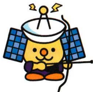
町キャラクター 「いて丸」