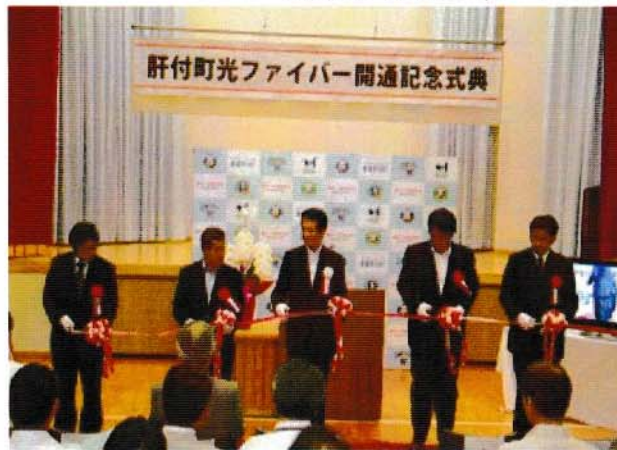
肝付町光ファイバー開通記念式典の様子