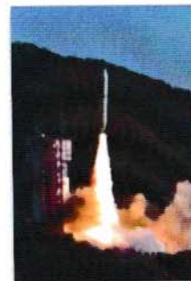
JAXA内之浦 宇宙空間観測所