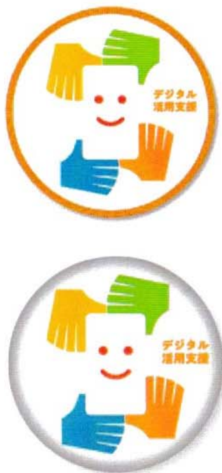
<ワッペン (イメージ) >