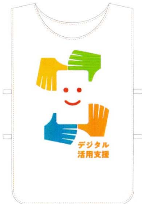
<ゼッケン (イメージ) >